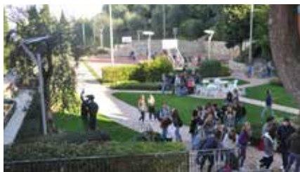
PARCO CON PISTA POLIVALENTE