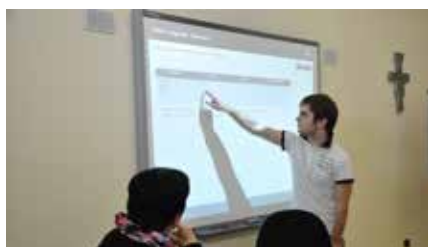
AULE DIDATTICHE CON LIM